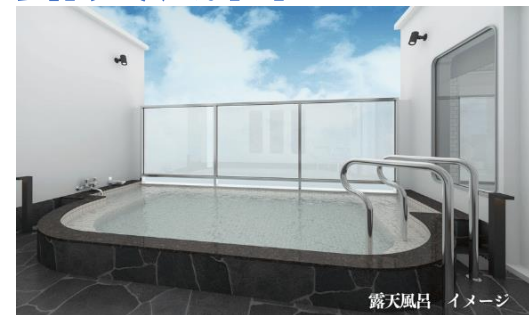
露天風呂 イメージ