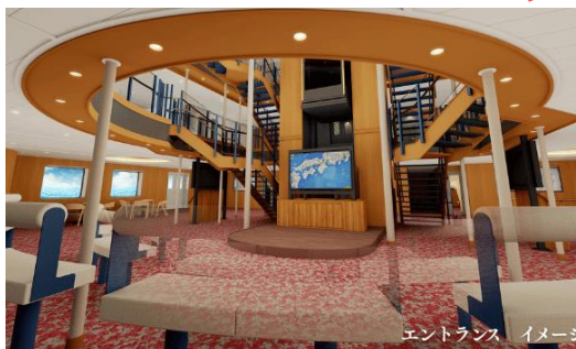
エントランス イメージ