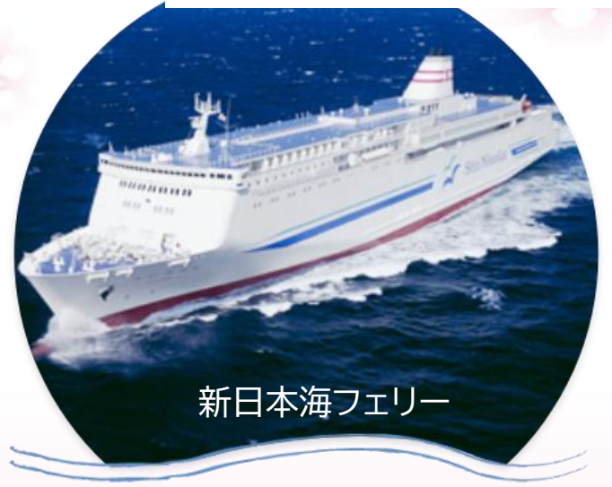
新日本海フェリー