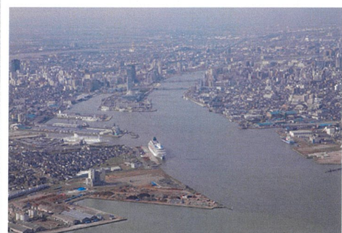
※新潟港振興協会HPより引用

新潟港の歴史は古く、平安時代の法令集「延喜式(えんぎしき)」に「蒲原津(かんばらのつ)」として登場します。信濃川と阿賀野川の二大河川の河口という水運の拠点として有効な場所に位置し、江戸時代は北前船の寄港地として大いに栄えました。安政5年(1858年)修好通商条約締結により、函館・横浜・神戸・長崎とならび、日本海側で唯一の開港五港の1つとして、明治元年11月19日に開港、現在まで続く国際貿易港の基礎となりました。