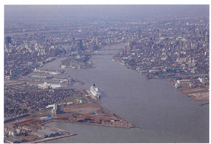
※新潟港振興協会HPより引用

新潟港の歴史は古く、平安時代の法令集「延喜式(えんぎしき)」に「蒲原津(かんばらのつ)」として登場します。信濃川と阿賀野川の二大河川の河口という水運の拠点として有効な場所に位置し、江戸時代は北前船の寄港地として大いに栄えました。安政5年(1858年)修好通商条約締結により、函館・横浜・神戸・長崎とならび、日本海側で唯一の開港五港の1つとして、明治元年11月19日に開港、現在まで続く国際貿易港の基礎となりました。